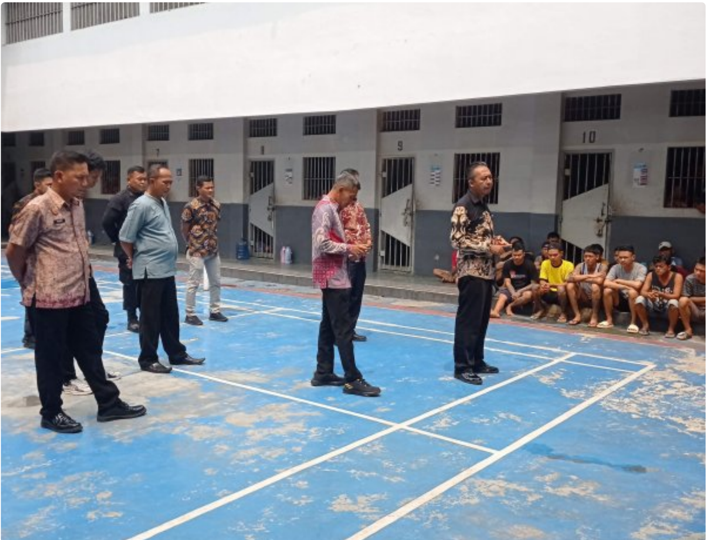
Lapas Purwokerto Tindaklanjuti Arahan Menimipas dan Kadivpas Kemenkumham Jateng

PURWOKERTO - Menindaklanjuti arahan Menteri Imigrasi dan Pemasarakan serta arahan dari Kepala Divisi Pemasarakan Kanwil Jateng Lapas Kelas IIA Purwokerto Menggelar Pengarahan kepada WBP terkait tata tertib, larangan dan